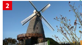
Soleweg – Nördlicher Rundkurs

Viel Abwechslung bietet der Soleweg. Besonders sehenswert sind die Windmühlen Exter und der sagenumwobene Wittekindstein. Hier sollen sich Kaiser Karl der Große und der kriegerische Sachsenherzog Wittekind versöhnlich die Hände gereicht haben.